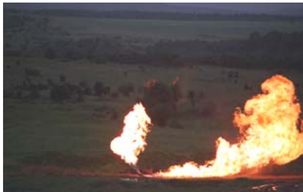
Obr.: Únik acetylenu a jeho hoření z tepelně zatížené plné tlakové lahve po několikanásobném prostřelení