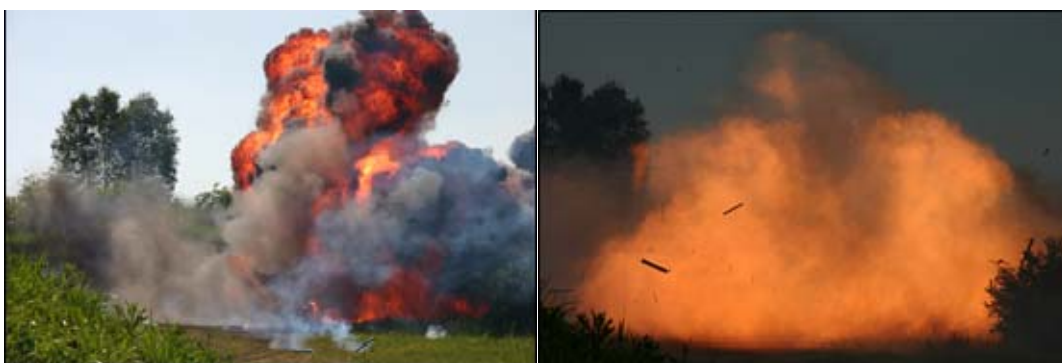
Obr.: Projev fyzikálního výbuchu lahve a shoření plynovzdušné směsi